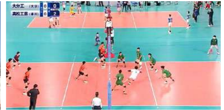
2022年1月 第74回「春高バレー」へ 出場した母校バレー部