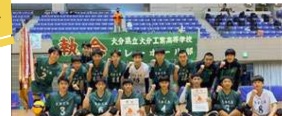
新人戦 会場 (べっぴんアリーナ) にて