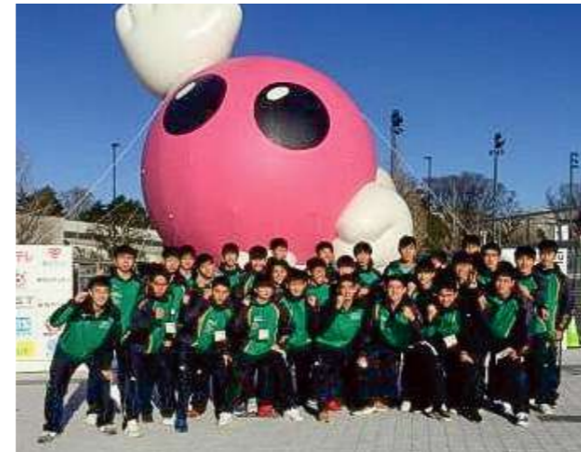
試合会場の東京体育館にて

令和4年度 東京豊工会総会・大同窓会 令和4年7月2日(土) 11:00~ 会場: アルカディア市ヶ谷