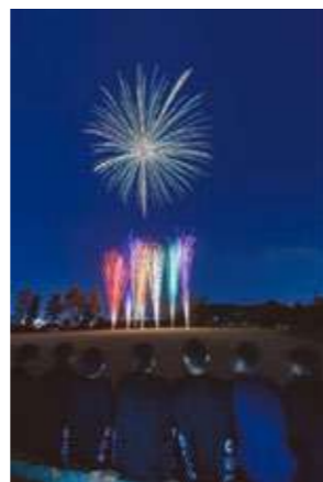
記念式典の前夜に打ち上げられた花火 (下の花火は6学科の色を表現しています。)