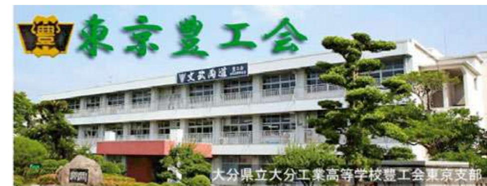
東京豊工会のホームページへようこそ！