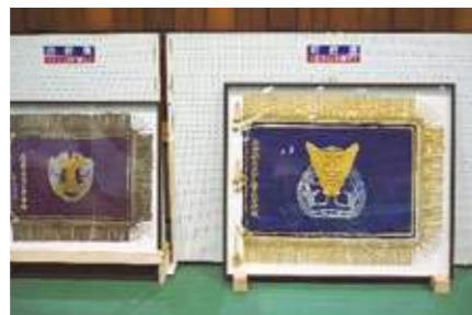
左 元校旗 大正10年制定 右 前校旗 昭和41年制定