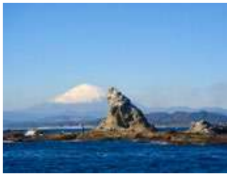
茅ヶ崎海岸・烏帽子岩

湘南会は平成18年(2006年)10月に発足し、今年10月で創立16年になります。コロナの為、令和2年度、3年度と2年続けて、忘年懇親会を中止し残念でな